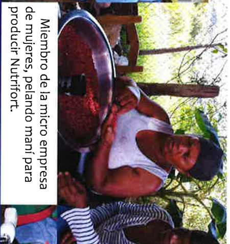
Miembro de la micro empresa de mujeres, pelando maní para producir Nutrifort.