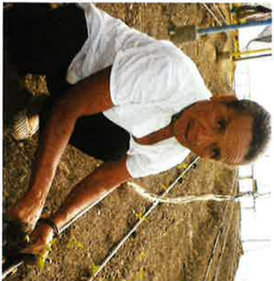
Mujer sembrando en un invernadero de la Federación de Agricultores