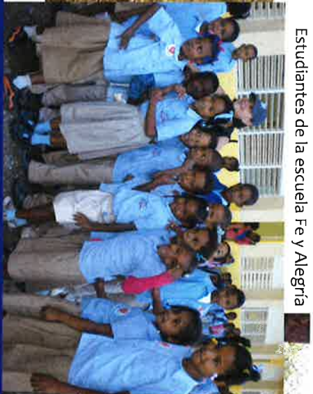
Estudiantes de la escuela Fe y Alegría